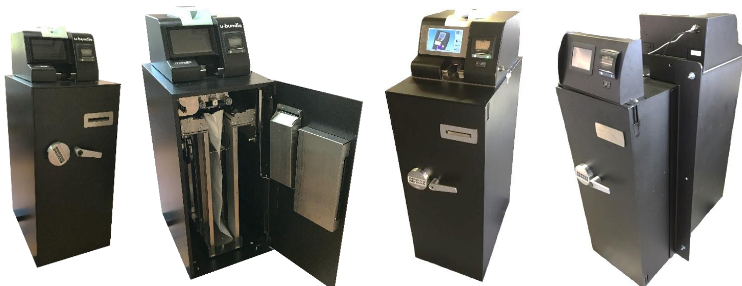
U-BUNDLE 2400/4000 STACKING