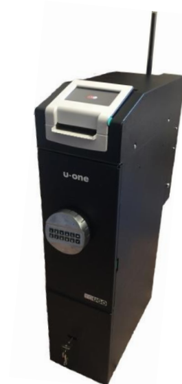
U-One 1200 con Rialzo

Opz. Stampante termica 60mm per stampa ricevute e pistola lettura codice a barre per lettura codici a barre dei sacchi e/o badge utenti con collegamento USB all'U-ONE